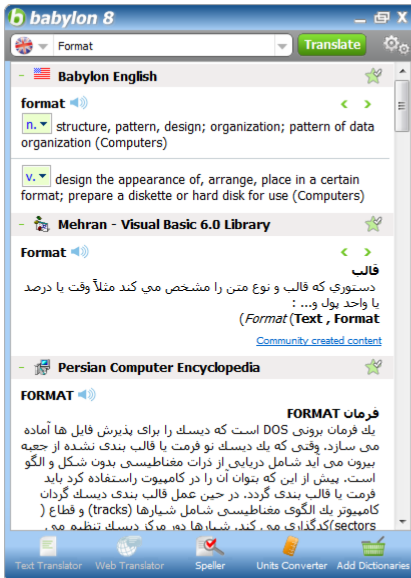
صفحه ی ترجمه ی بابلون نگارش ۸

مترجم واژه ی بابلون در سال ۱۹۹۷ عرضه شد. البته ایده ی اولیه ی آن در سال ۱۹۹۵ برای ترجمه ی انگلیسی – عبری شکل گرفت و هدف آن بود که بدون ایجاد وقفه در خواندن متن، آن را ترجمه کند. روش کار به گونه ای است که با راست کلیک (ترکیب آن با دکمه ی کنترل و ...) روی یک واژه، پنجره ی بابلون حاوی ترجمه ی آن واژه ظاهر می شود. ابزار تبدیل واحد پولی هم یکی دیگر از امکانات این برنامه است. بابلون یک موتور تشخیص متن از تصویر (OCR) دارد که در محیط برنامه های مختلف ویندوز مانند ورد، آفوتلوک، اکسل، اینترنت اکسپلورر و آدوب آکروبات با یک کلیک فعال می شود و ترجمه ی واژه را در همان پنجره نمایش می دهد. بابلون ۸ امکان ترجمه ی متنی، صفحه ی وب و فایل را برای ۳۳ زبان به همدیگر فراهم می سازد و با غلط یاب املایی میکروسافت آفیس هم سازگاری دارد.