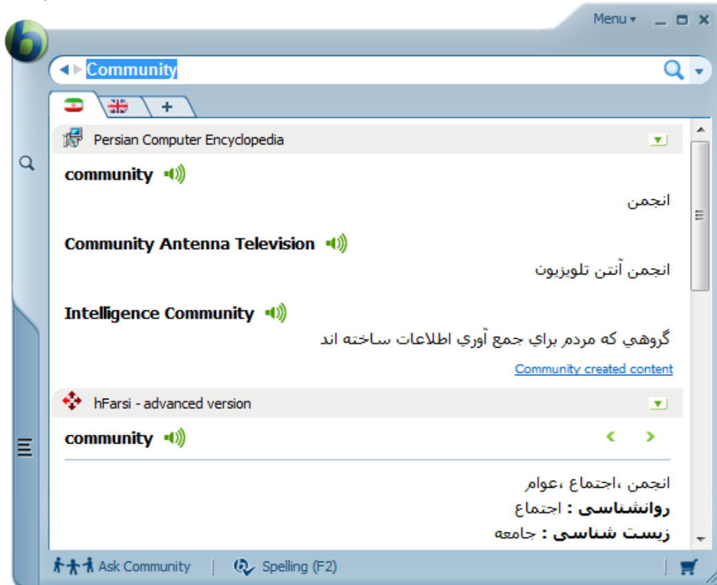
صفحه ی ترجمه ی واژه - بایبلون ۹